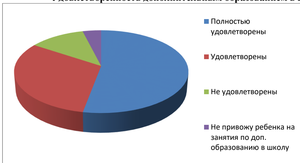
Удовлетворенность дополнительным образованием в 2021 году

Ведётся работа по предупреждению факторов девиантного поведения обучающихся: